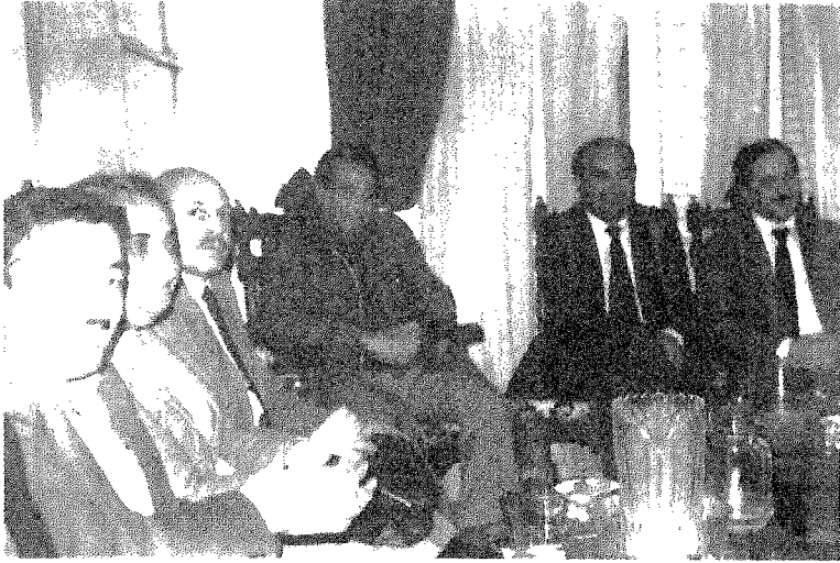
في حفل توسيع جود بانضمام التجمع الديمقراطي العراقي وأحزاب أخرى إليها